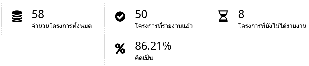
กราฟแสดงภาพรวมโครงการ