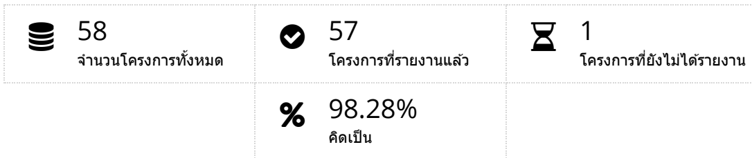
กราฟแสดงภาพรวมโครงการ